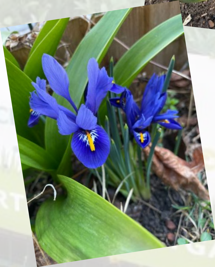
Frühlingsbeginn im Albertgarten (1.3.2022)