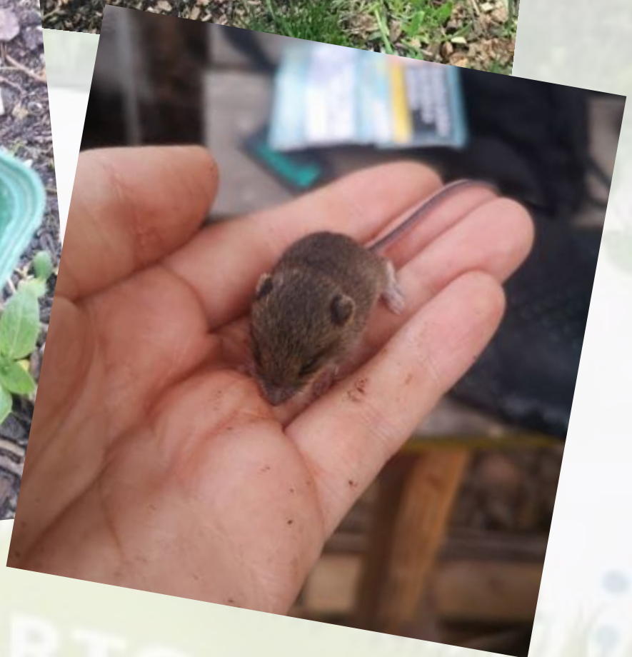
Gartenarbeit für Judith, Carola und Eva am 6.5.2022: Das Rosenbeet bekommt eine neue Einfassung aus alten Ziegeln; beim Kompostumsetzen haben die Gärtnerinnen ein Mäusenest ausgehoben.